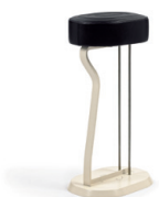
BAR STOOL NO. 2 1928